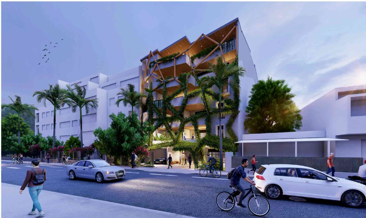
Vue depuis la rue du Général De Gaulle à Saint Denis