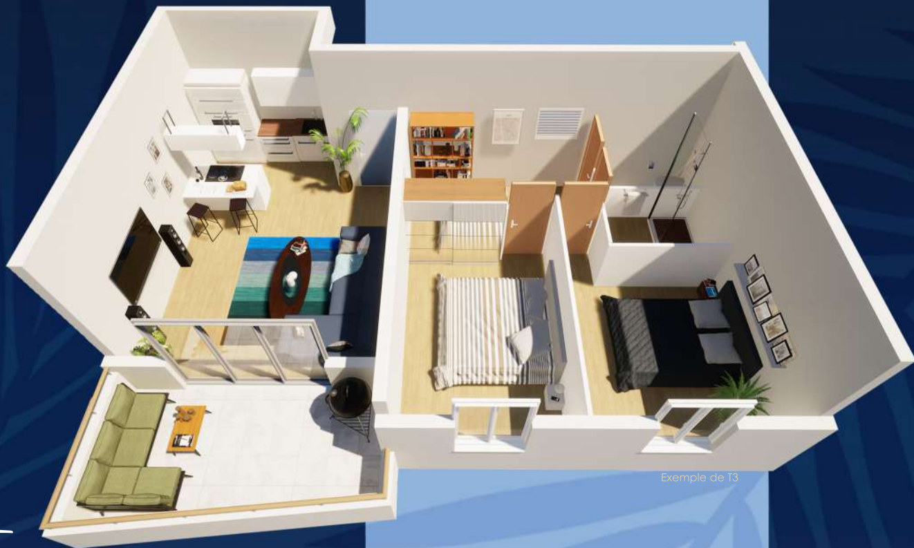
Exemple de T3