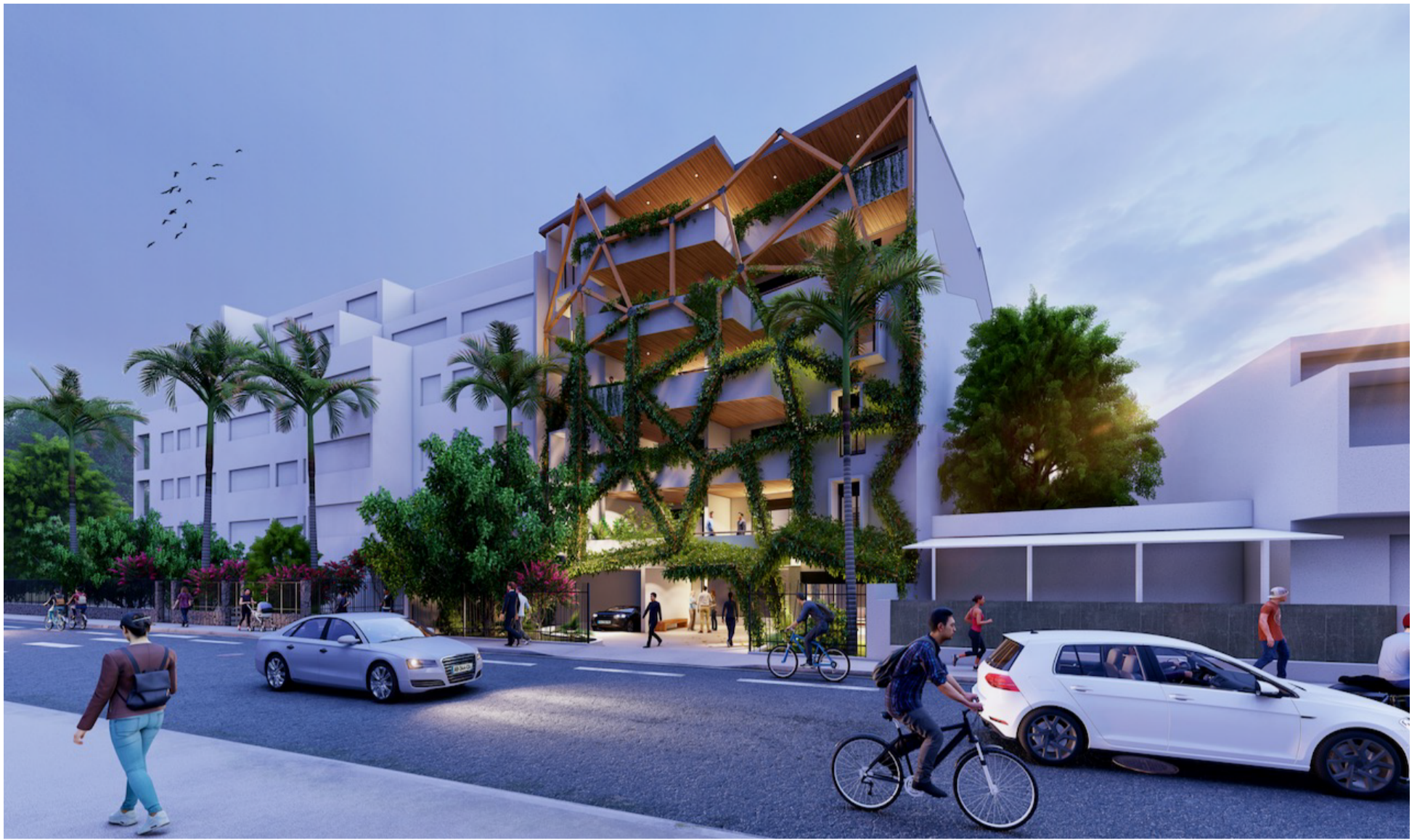
Vue depuis la rue du Général De Gaulle à Saint Denis